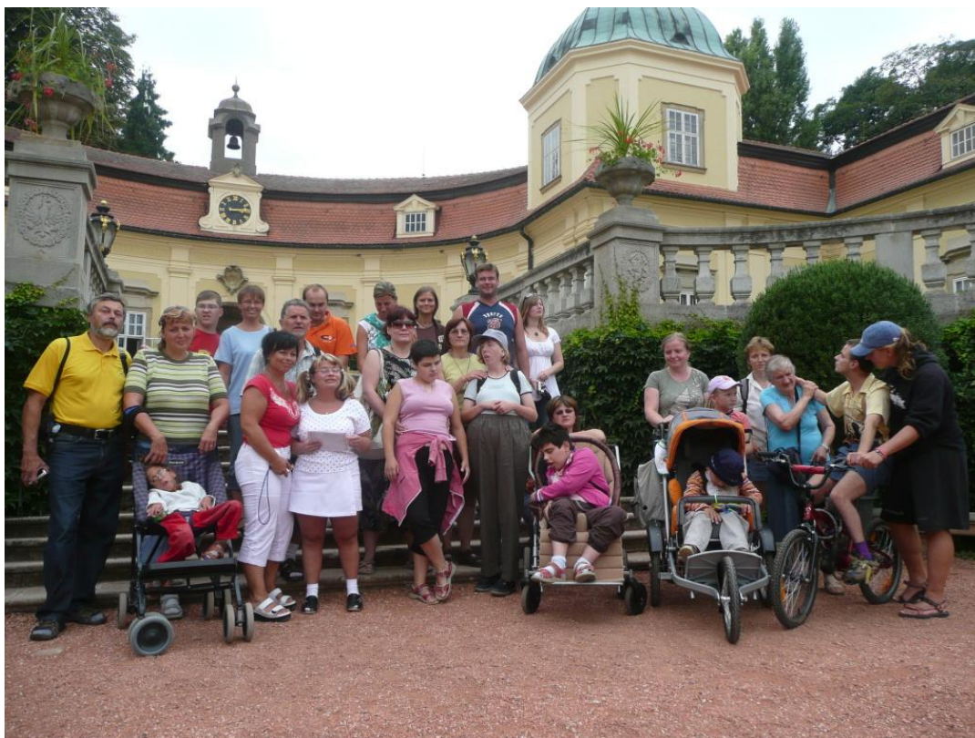
Z prázdninového pobytu 2008 – Komňa - Kopánky

Způsobuje především potíže při komunikaci, prostorové orientaci a samostatném pohybu, sebeobsluze a přístupu k informacím. Zabraňuje hluchoslepému člověku plnohodnotně se zapojit do společnosti a vyžaduje zajištění odborných služeb, kompenzačních pomůcek a úpravy prostředí.