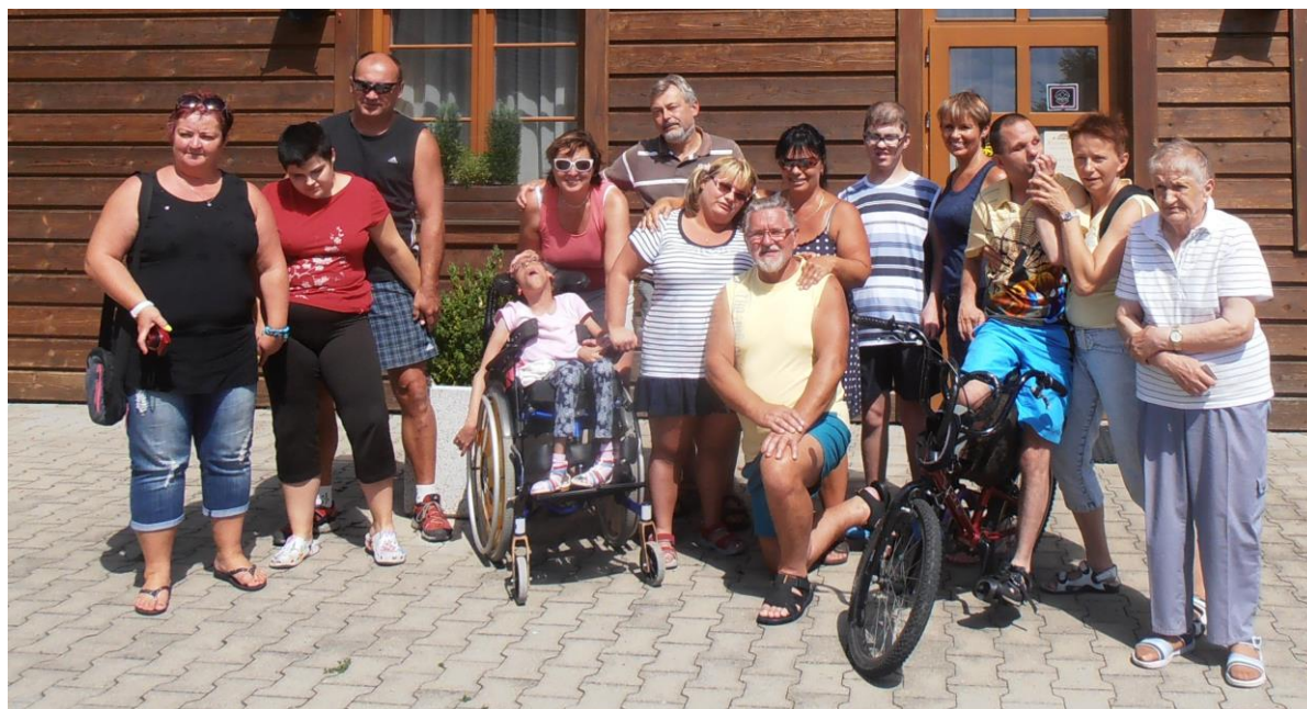
PRÁZDNINOVÝ POBYT NA SLOVENSKU – Selce, Fuggerov Dvor, 16. – 22. 8. 2015

Občanská sdružení poskytující služby hluchoslepým a sdružující hluchoslepe v České republice, evidují pouze cca 120 osob.