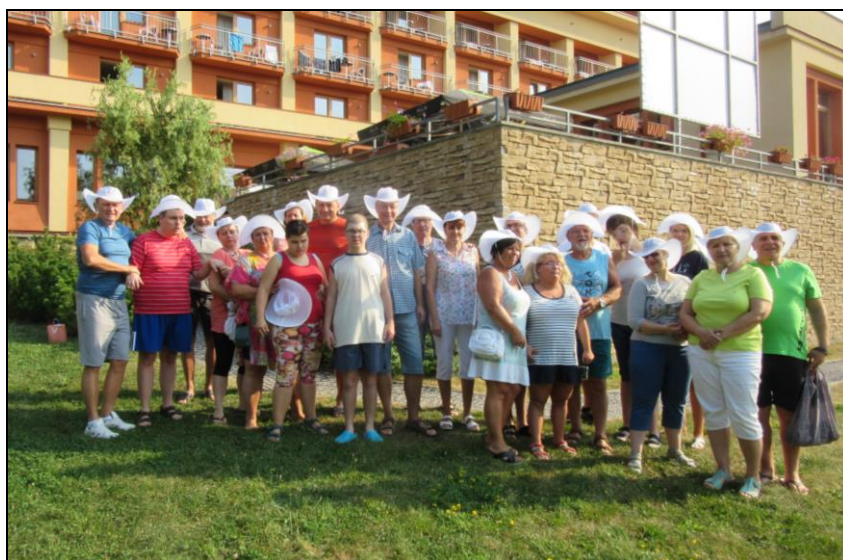
PRÁZDNINOVÝ POBYT - ROŽNOV pod RADHOŠTĚM, Česká republika

Cílem spolku je zaměřit se na efektivní informační komunikaci mezi společnostmi a hluchoslepy dětmi, prosazování práv, zájmů a potřeb takto postižených dětí a zabezpečení životních podmínek těchto dětí v dospělém věku. Dalším cílem je podpora maximální integrace hluchoslepých dětí a osob do společnosti, organizace výchovně vzdělávacích akcí, programů a aktivit pro hluchoslepy a jejich rodiny. V této činnosti spolek spolupracuje s neziskovými organizacemi, státními orgány, sdělovacími prostředky, zabývajícími se obdobnou problematikou. Konkrétním cílem je vytváření podmínek pro kulturní, společenské, rekreačně poznávací akce a pobyty pro hluchoslepy.