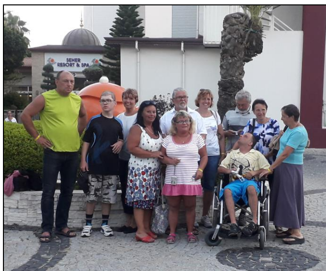
TURECKO – prázdninový pobyt

Cílem spolku je zaměřit se na efektivní informační komunikaci mezi společnostmi a hluchoslepy dětmi, prosazování práv, zájmů a potřeb takto postižených dětí a zabezpečení životních podmínek těchto dětí v dospělém věku. Dalším cílem je podpora maximální integrace hluchoslepých dětí a osob do společnosti, organizace výchovně vzdělávacích akcí, programů a aktivit pro hluchoslepy a jejich rodiny. V této činnosti spolek spolupracuje s neziskovými organizacemi, státními orgány, sdělovacími prostředky, zabývajícími se obdobnou problematikou. Konkrétním cílem je vytváření podmínek pro kulturní, společenské, rekreačně poznávací akce a pobyty pro hluchoslepy.