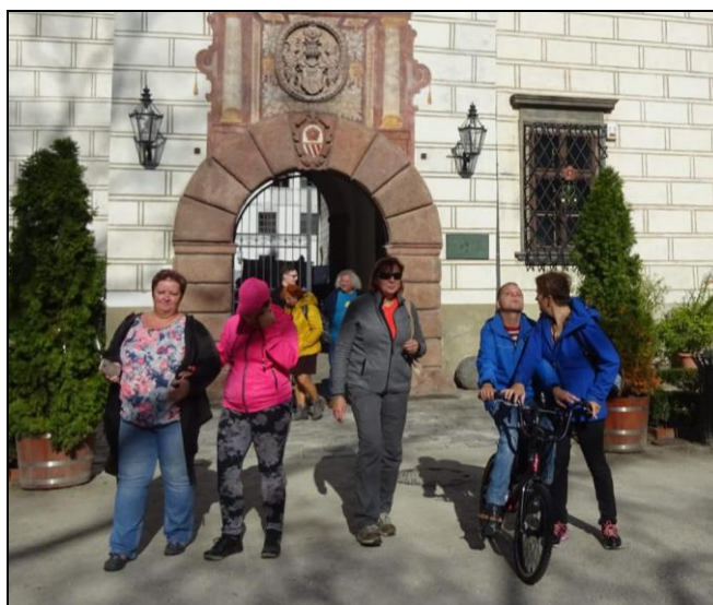
TŘEBOŇ – víkendový pobyt

ZÁBLESK – sdružení rodičů a přátel hluchoslepých dětí a osob, z.s., Lubina 338, 742 21 KOPŘIVNICE